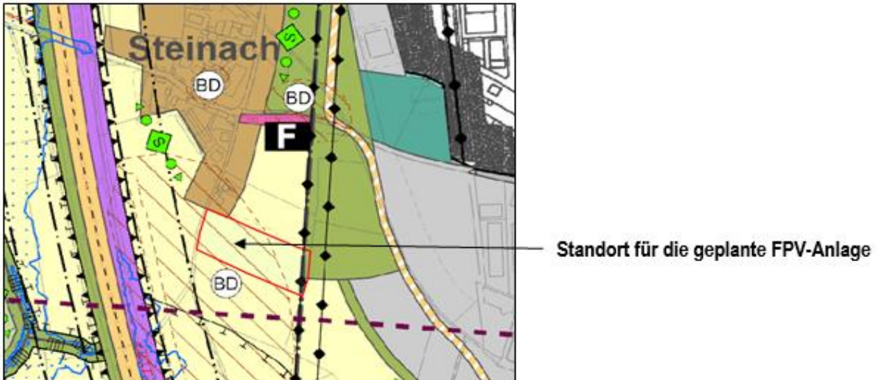
Abb.1: Ausschnitt aus dem wirksamen FNP

Nach den Vorgaben des Baugesetzbuches ist für Photovoltaik-Freiflächenanlagen eine Privilegierung nicht gegeben, da sie ihrem Wesen nach nicht an den Außenbereich gebunden sind. Auch eine Zulassung als sonstige Vorhaben im Sinne von § 35 Abs. 2 BauGB wird in der Regel wegen der Veränderung des Landschaftsbildes und der damit nicht von vornherein gegebenen Vereinbarkeit mit öffentlichen Belangen ausscheiden.