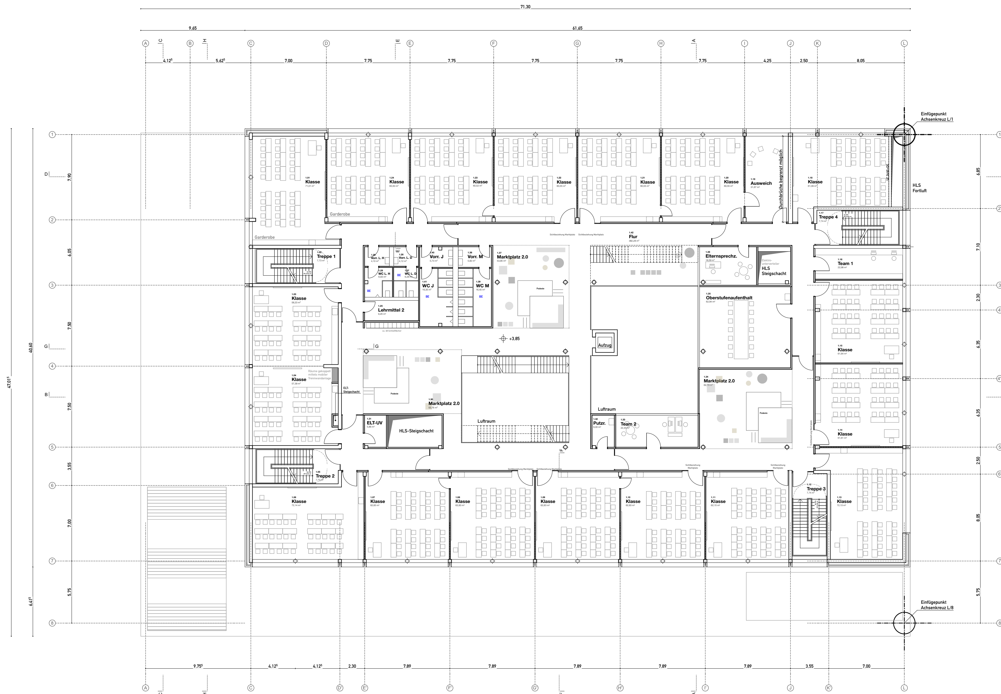
GRUNDRISS Ebene 1 1:200