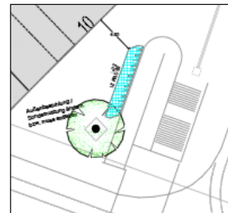
Abb. 2: optionaler Standort (1/3)

Gleichzeitig sollen entlang der Gustav-Schickedanz-Straße insgesamt 64 Fahrradparker an acht Standorten installiert werden. Diese werden in der Achse der Baumschreiben angebracht. Der Bedarf für diese (und ggf. weitere) Fahrradständer ist offenkundig, da zahlreiche Fahrräder an den Baumschutzbügeln oder ungeordnet abgestellt werden.