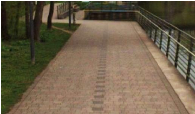
Foto: Uferpromenade mit andersfarbigen Pflastersteinen als Trennlinie

Beide Weghälften sind mittels eines andersfarbigen Pflasters (als Trennlinie) voneinander getrennt. Diese Pflasterreihe baulich zu entfernen und das Pflaster von der Farbgebung her entsprechend anzupassen würde einen hohen finanziellen Aufwand bedeuten.