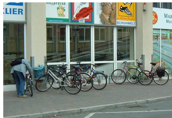
Fahrradständer vor dem ehemaligen Marktkaufgebäude (Fotos: Stadtplanungsamt, September 2003)