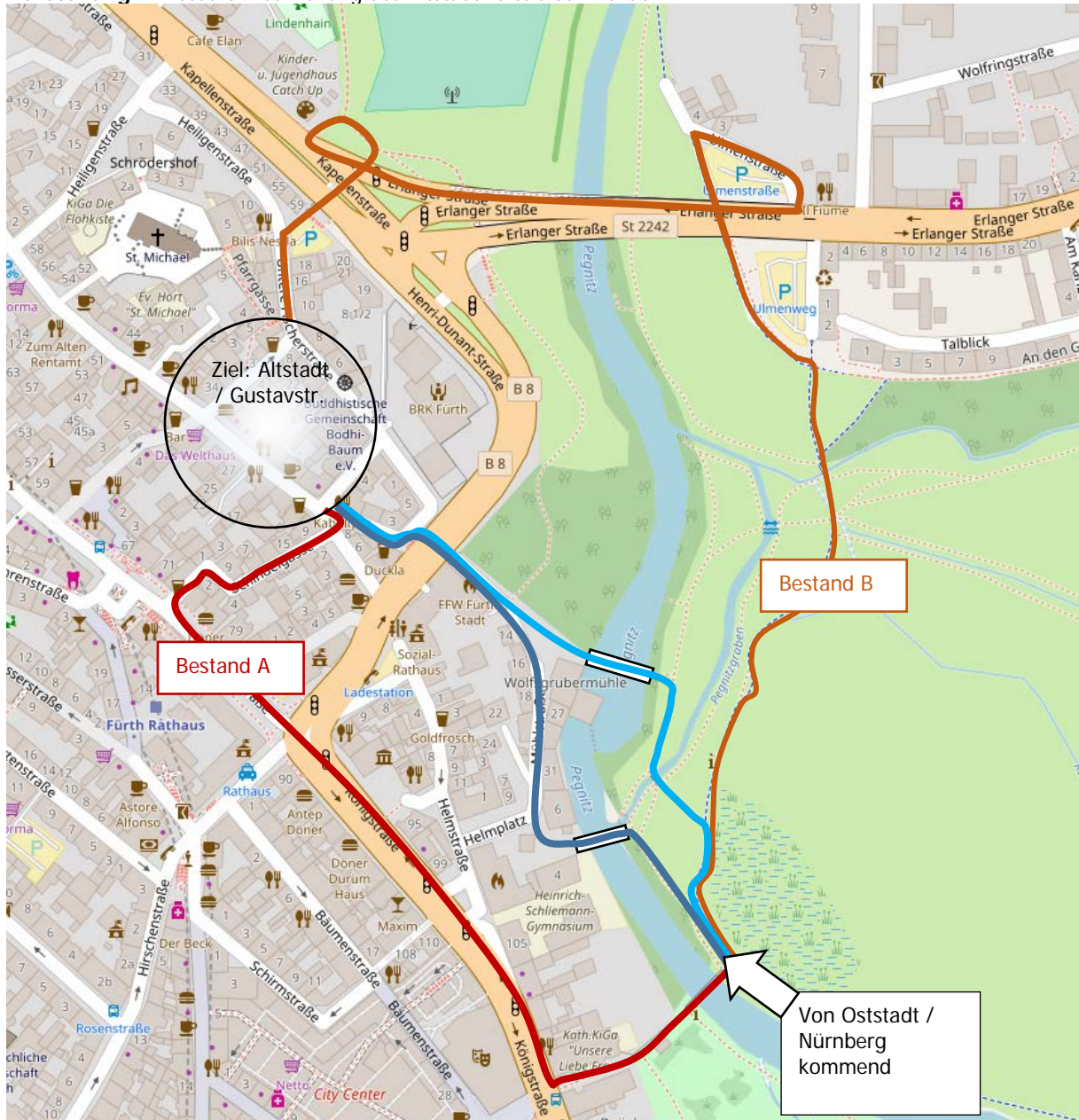
Darstellung 1: Bessere Erschließung des Altstadtviertels St. Michael