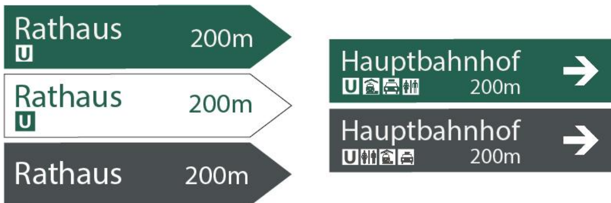
Abb. 3 Vorschläge zur Darstellung der Schilder

Optische Vorgaben für die Schilder sind: