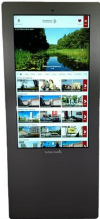
Abb. 1 Beispiel digitaler Infoterminal

Das Besucherleitsystem soll durch digitale Infostelen sinnvoll ergänzt werden.