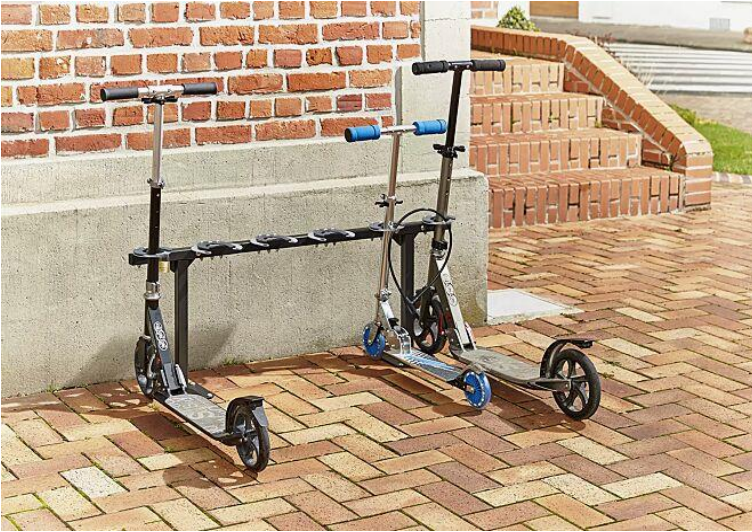
Katalogprodukt „Scooter-Parker“, Länge 106 cm, mit sechs Einstellplätzen, zum Aufdübeln oder zur Wandmontage, EP 266,00 € netto ohne Montage (2023)