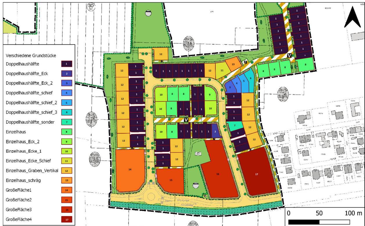
Abbildung 2: Verschiedene Grundstückstypen im geplanten Wohngebiet "westliche Magnolienweg" Burgfarnbach.

Die Grundstücksgrößen und Dimension der geplanten Versickerungsmulden wurden aus dem Bebauungsplan übernommen. Zudem wurden den Berechnungen die Festsetzungen aus dem Bebauungsplan zugrunde gelegt. Für die Berechnungen der Überflutungsnachweise nach DIN 1986-100 wurde für jedes Grundstück der jeweils ungünstigste Bebauungsfall (größtmögliche Dachfläche und volle Ausschöpfung der maximalen befestigten Flächen) herangezogen. Ferner wird davon ausgegangen, dass die Grundstücke ein geringes Gefälle in Richtung Versickerungsmulde aufweisen und anfallendes Niederschlagswasser direkt in die Mulden geleitet wird.