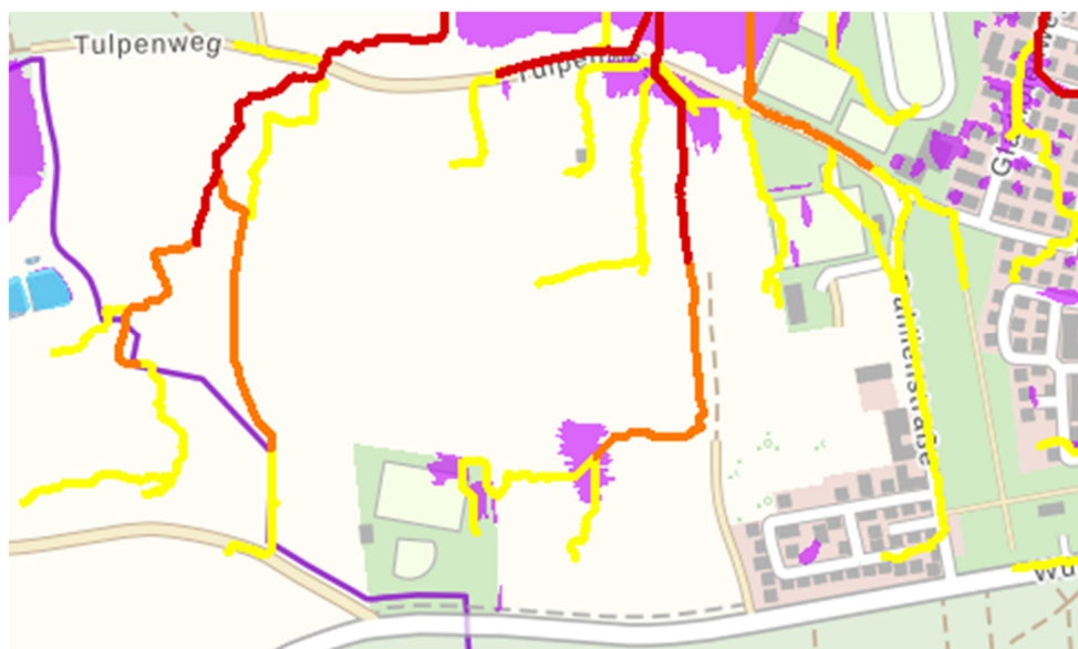
Abbildung 3: Darstellung Oberflächenabfluss und potentielle Aufstaubereiche am Standort (Umweltatlas Bayern 2024).

Bei fachgerechter Infrastrukturplanung und Auslegung der Niederschlagswasserversickerung am Standort ist mit keiner größeren Auswirkung der angegebenen Aufstauflächen und Abströme zu rechnen.