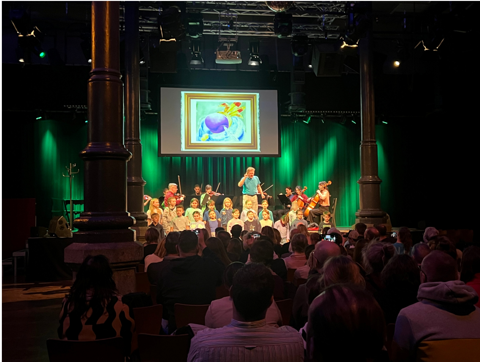
„Ein Fall für Paule Paulson“ in Kooperation mit GERALDINO 2025 – Kulturforum Fürth