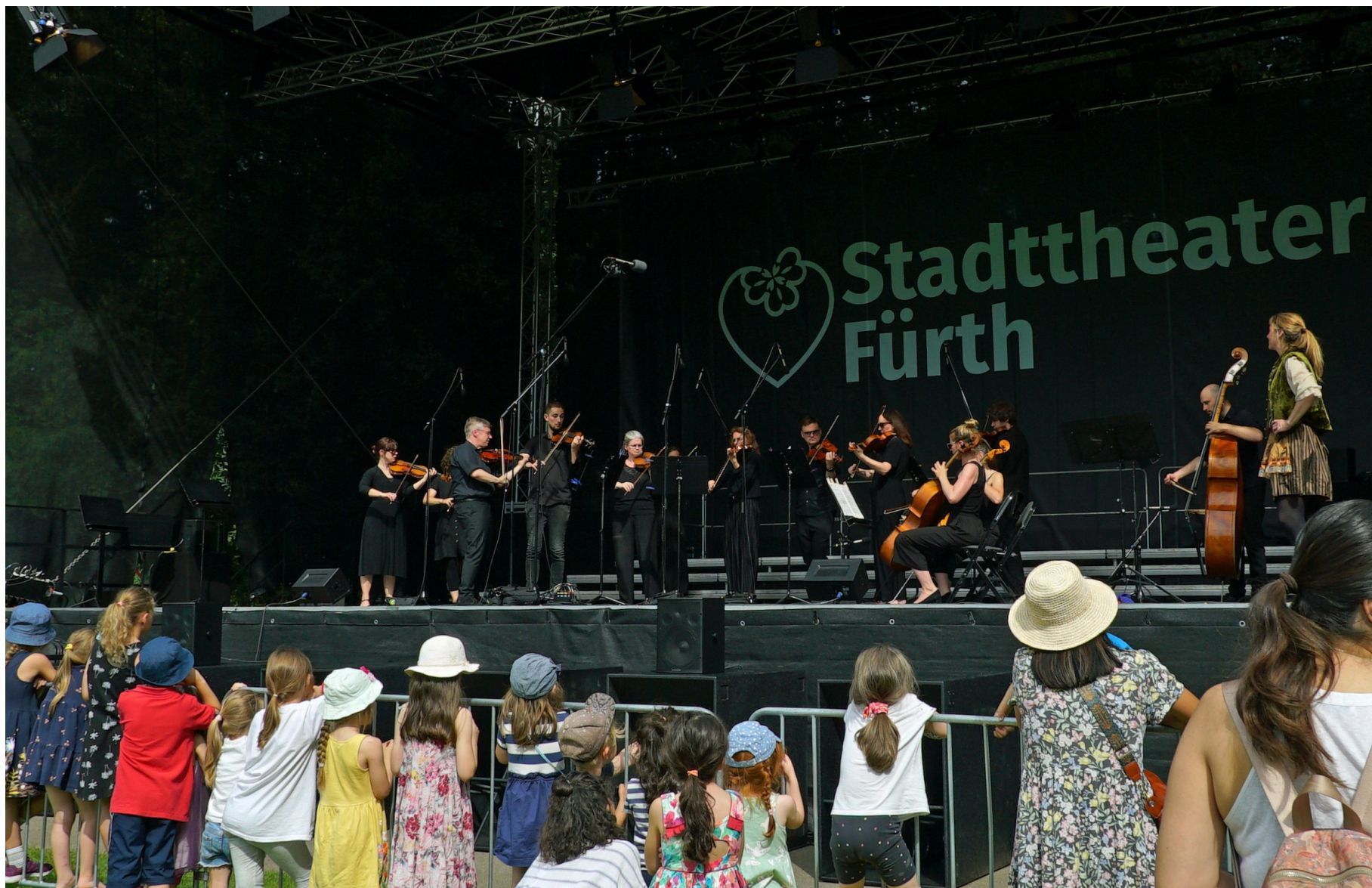
„Aus Holbergs Zeit – das verzauberte Orchester“ Classic Day for Kids 2024 – Stadtpark Fürth