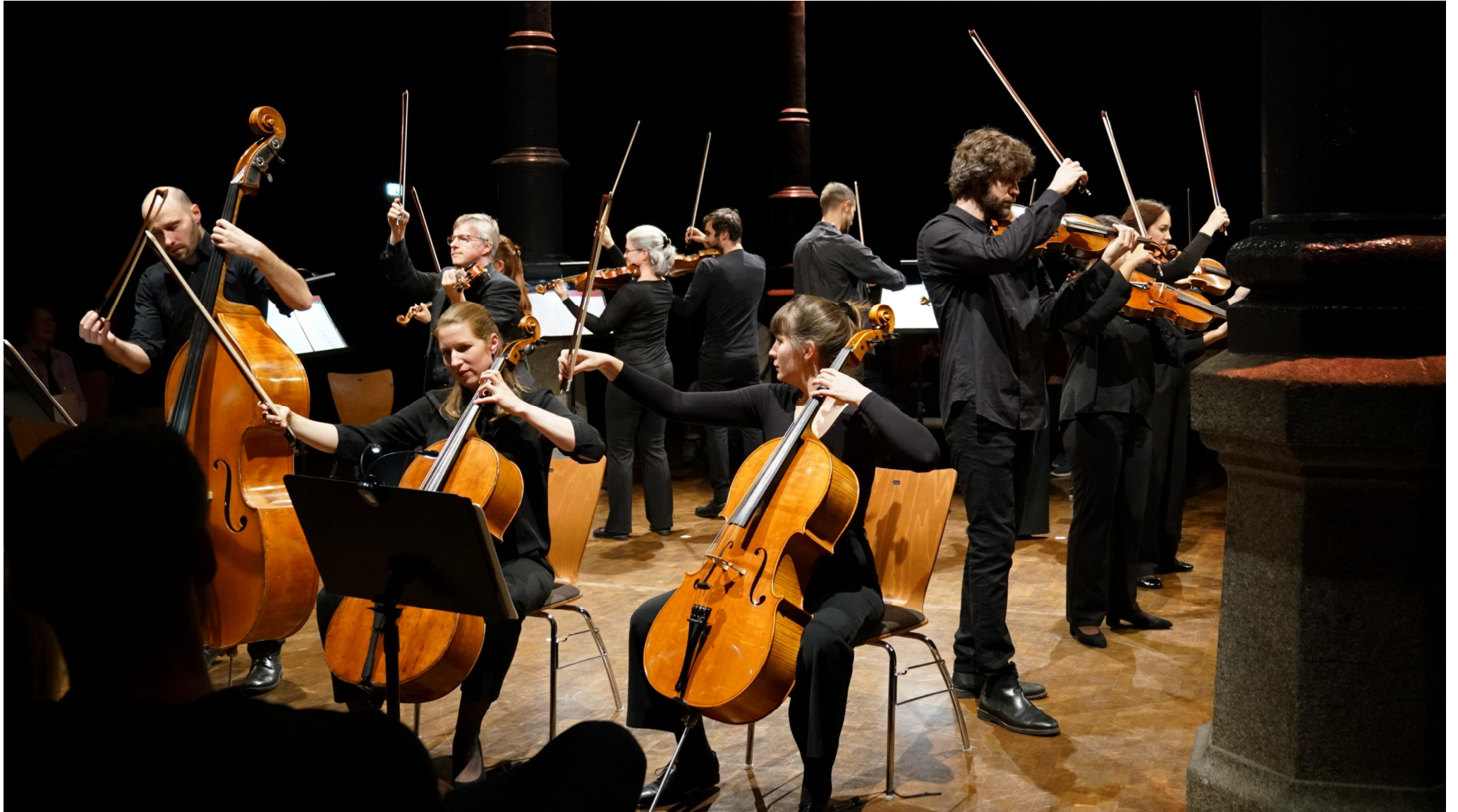
„Metamorphosis“ 2024 – Kulturforum Fürth