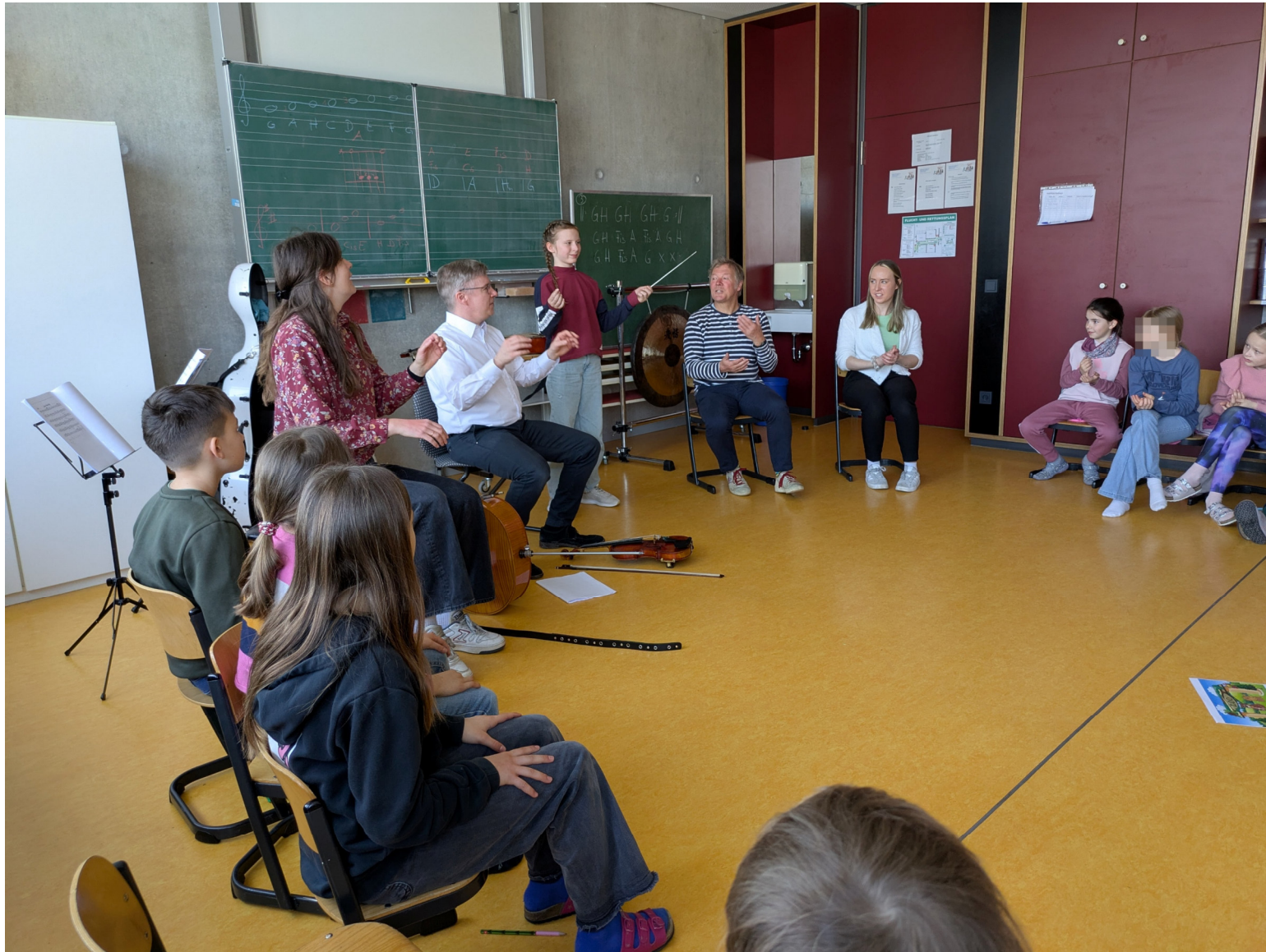
Workshop mit Orchester Ventuno und Geraldino an der Maischule Fürth