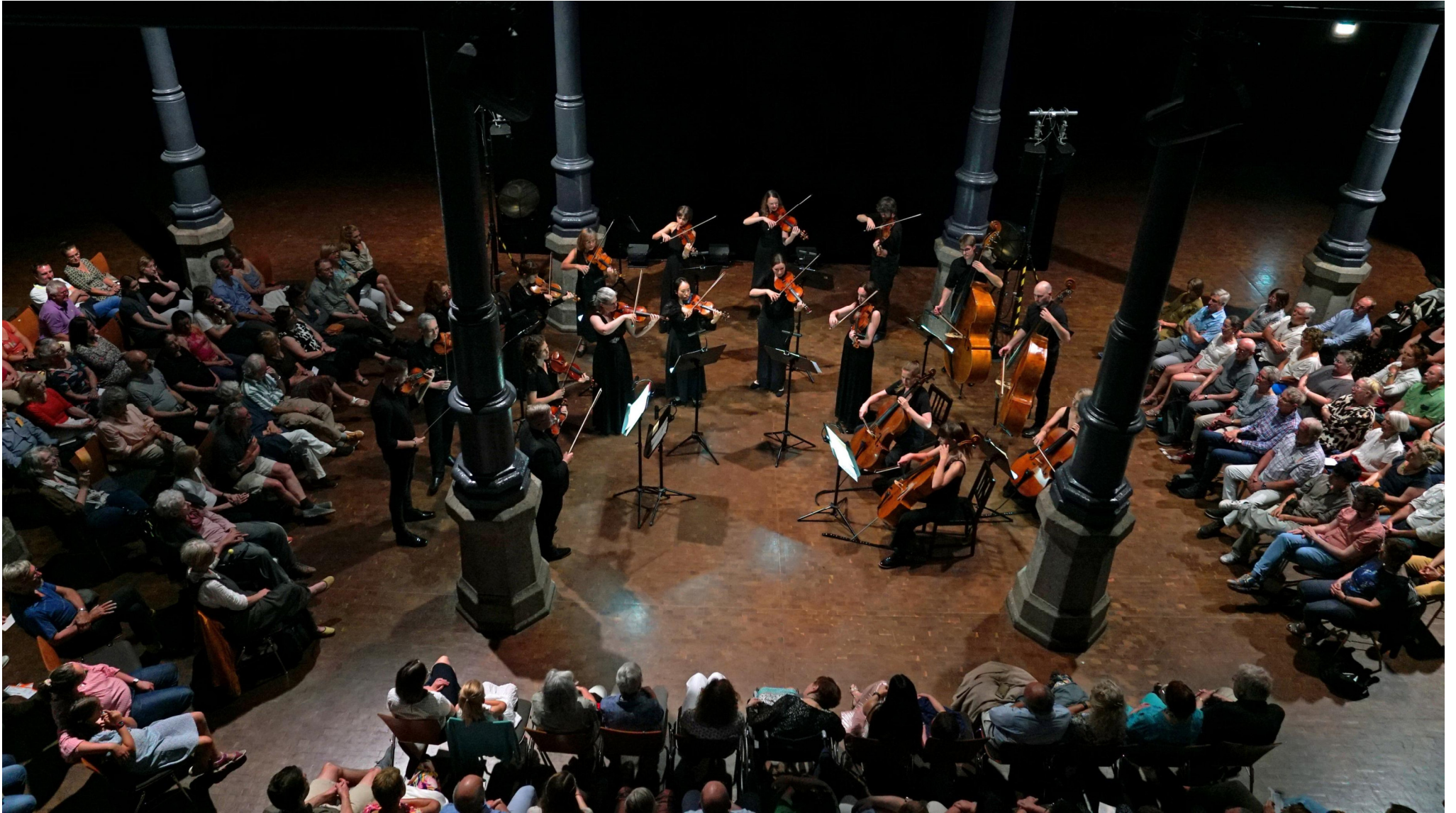
Jubiläumskonzert 2024 – Kulturforum Fürth