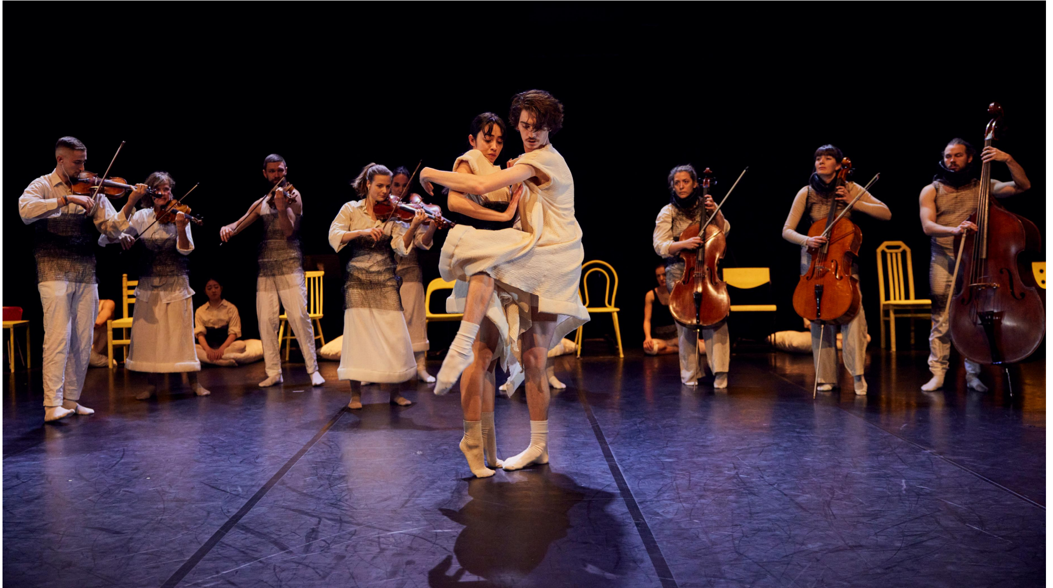
„Der Process“ musikalisch-tänzerisches Bühnenstück in Kooperation mit SETanztheater und Friederike Bernhardt