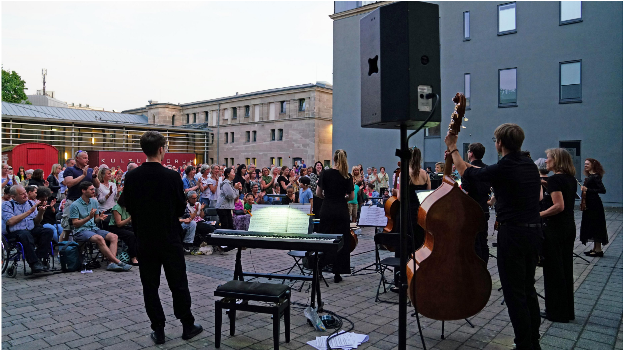
„Cinema Ventuno“ 2025 – Piazza Kulturforum Fürth