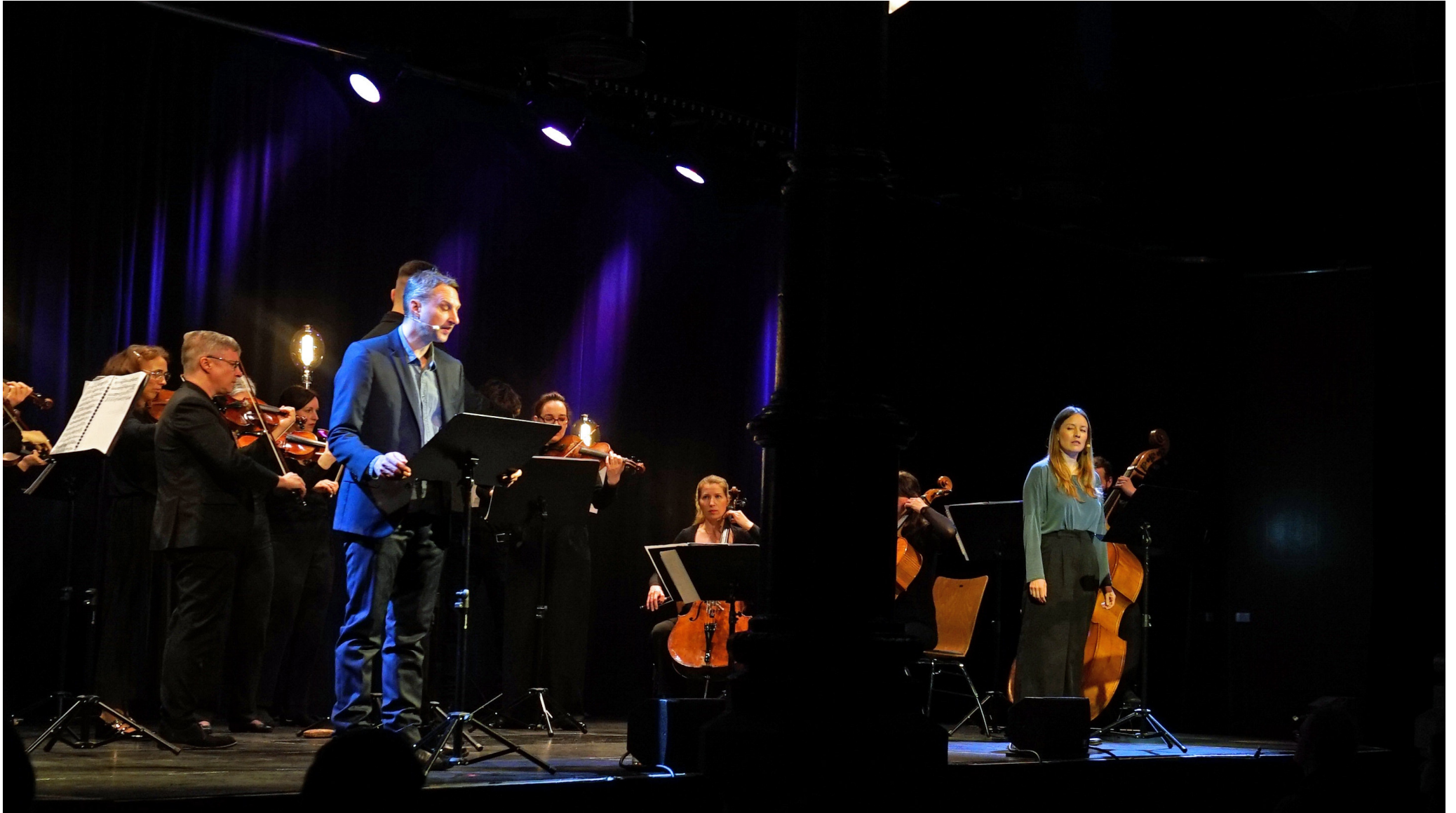
„Gegen das Vergessen – eine musikalische Lesung über jüdisches Leben in Fürth/Nürnberg während der NS-Zeit“ – Kulturforum Fürth