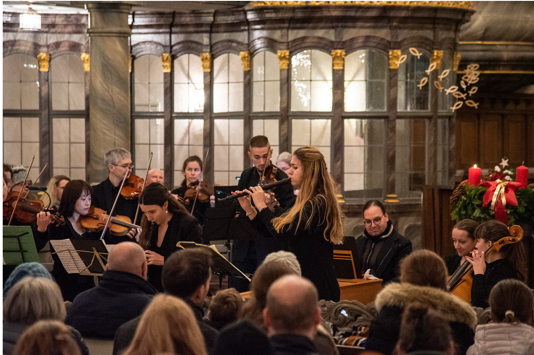
„Concerto 5.0“ - St. Laurentius Altdorf