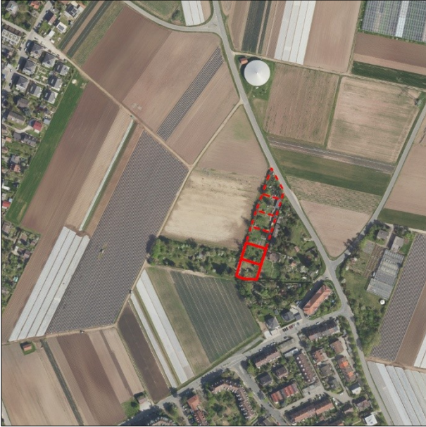
Luftbild der Stadt Fürth v. 11.04.2024, ohne Maßstab