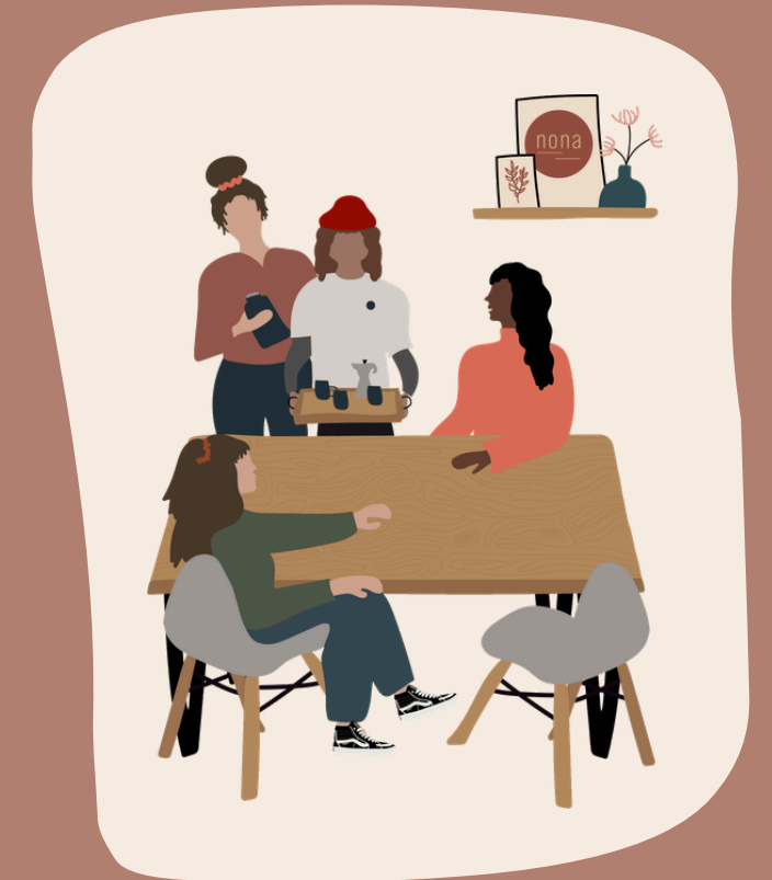
Öffentlichkeits- & Netzwerkarbeit