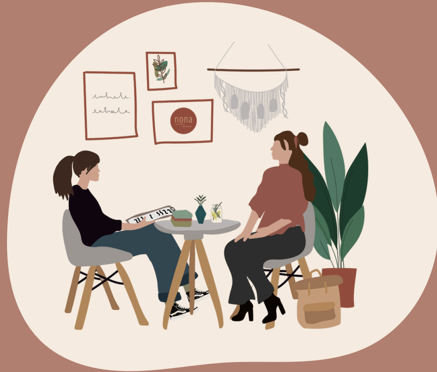
Anlauf- & Beratungsstelle nona