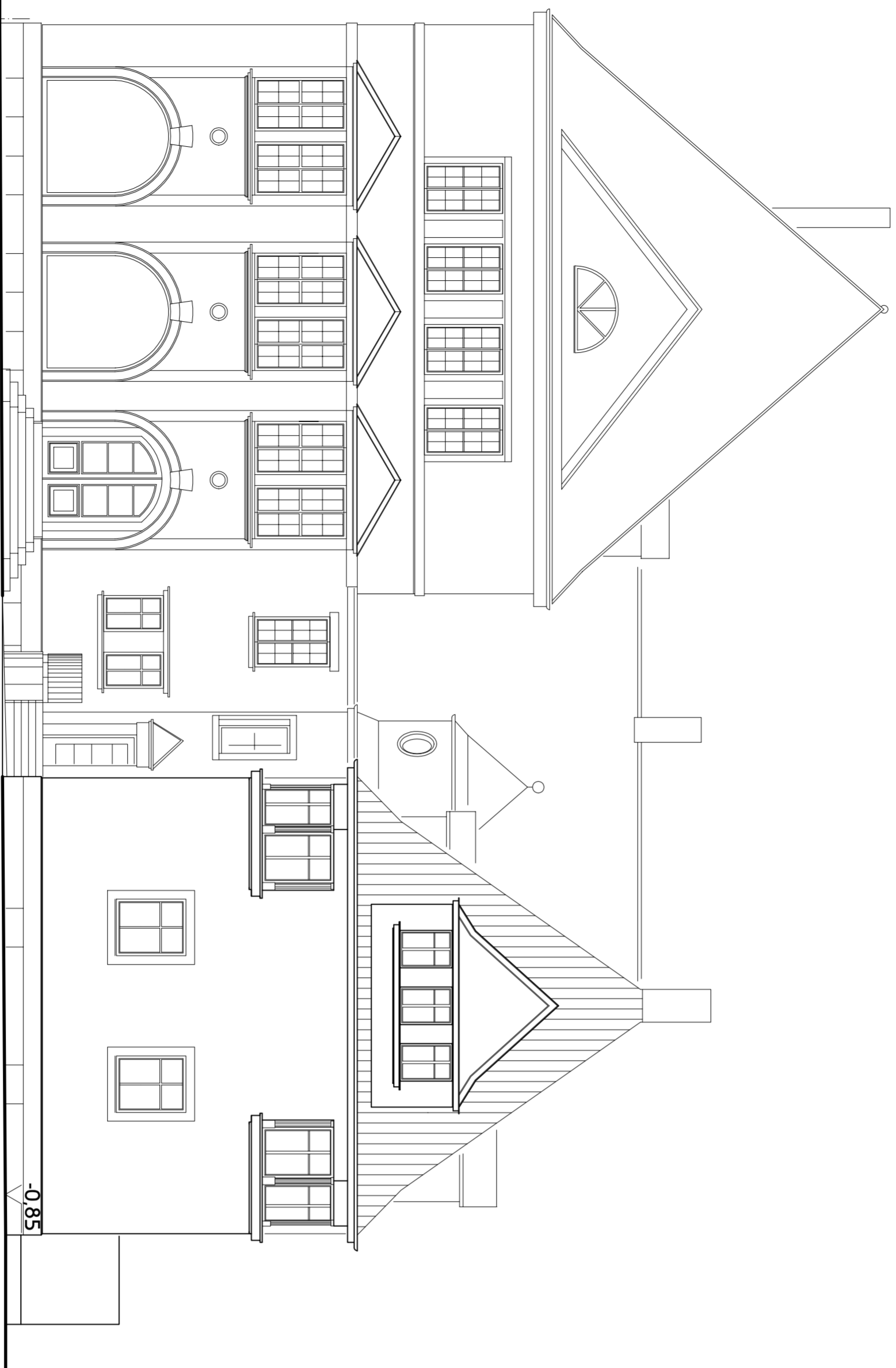
nordwest-ansicht - ottostraße